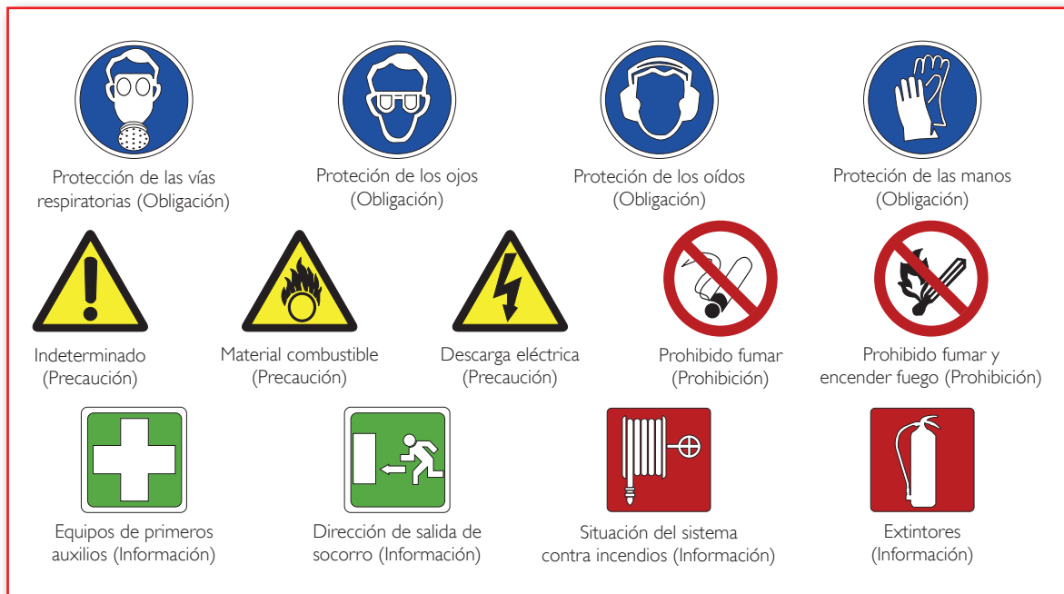
Figura 13. Señales de advertencia o precaución, prohibición, obligación, salvamento o socorro (información).