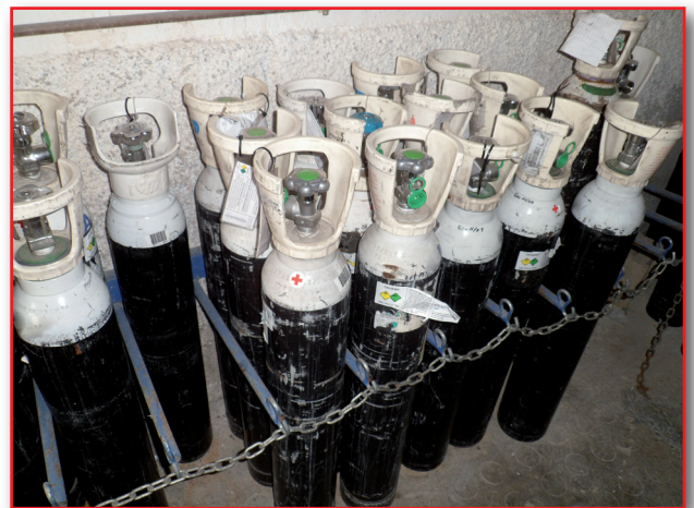
Figura 17. Almacenamiento de bombonas de oxígeno medicinal.

El oxígeno tiene unas propiedades altamente inflamables, por lo que puede provocar un incendio con mucha facilidad, de modo que es necesario atender todas las consideraciones de seguridad específicas durante su manipulación.