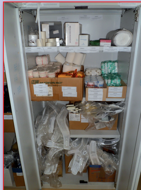
Figura 6. Armario de gasas, vendas, etc.