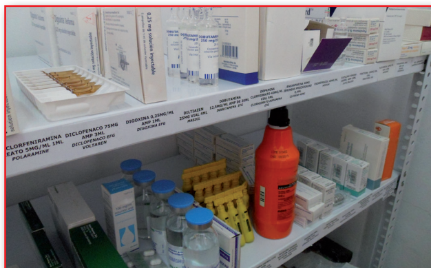
Figura 1. Almacenamiento.