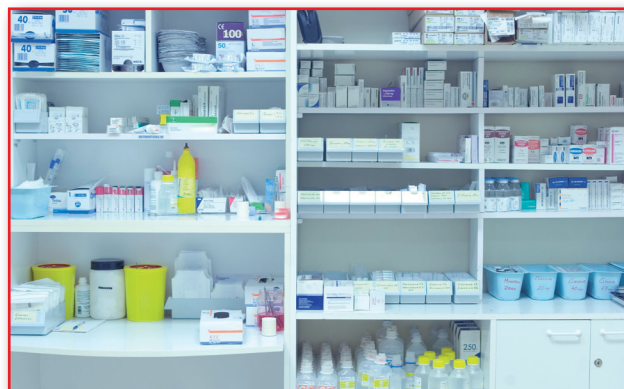
Figura 2. Almacenamiento.