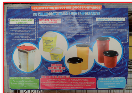
Figura 16. Cartel de jaulas de desechos biosanitarios.