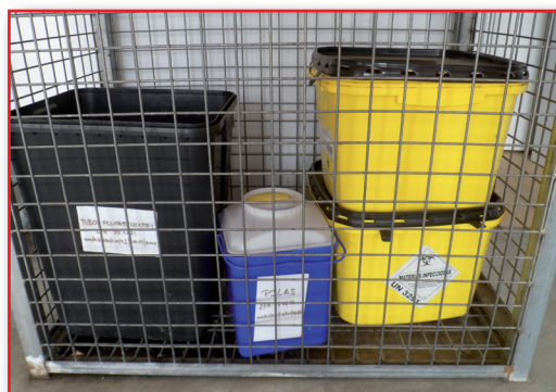
Figura 15. Jaulas de desechos biosanitarios.