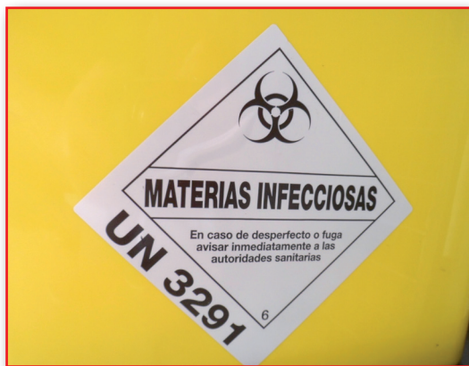
Figura 14. Pictograma de desechos biosanitarios.