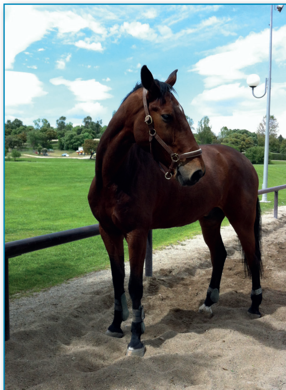
Figura 4. Caballo en buena condición física y buen estado de salud.