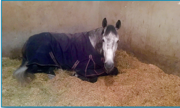
Figura 14. Caballo descansando en un box.

¿Cómo debemos preparar a los caballos para la pernoctación? (Figura 14). Las principales acciones a desarrollar en caso de pernoctación son las siguientes: