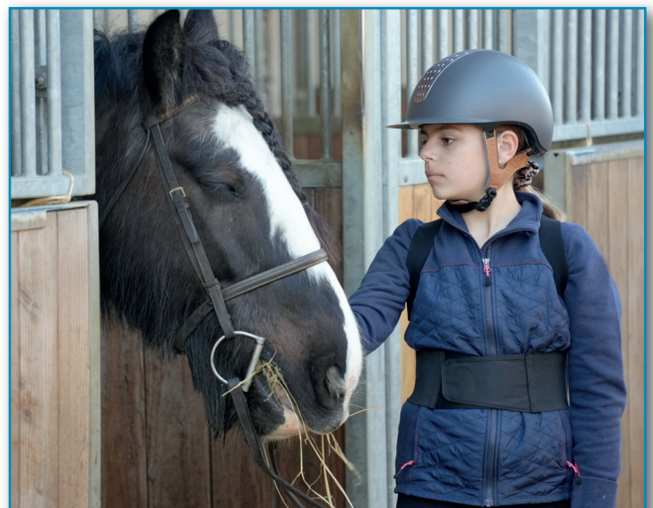
Figura 11. Poni de la mano.