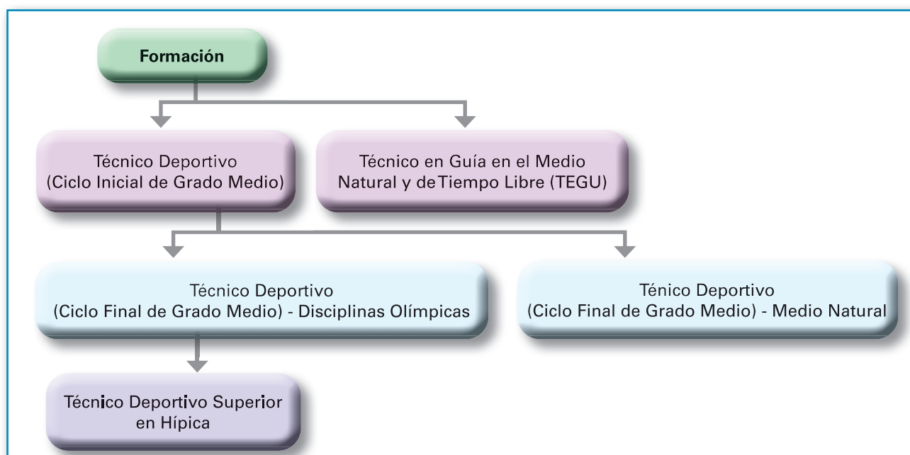
Figura 5. Tipos de formación reglada en España relacionada con el deporte.

El enfoque de la formación reglada relacionada con el deporte queda plasmado en el gráfico que se presenta en la Figura 5.