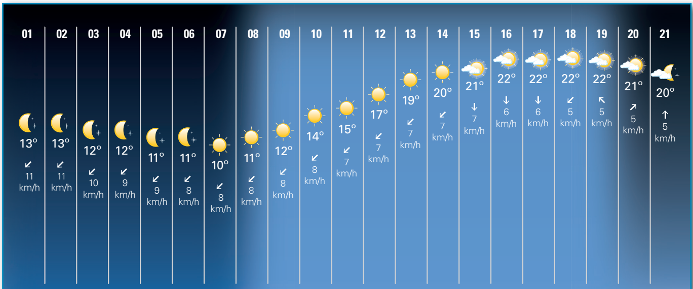
Figura 2. Es muy importante consultar la previsión meteorológica.