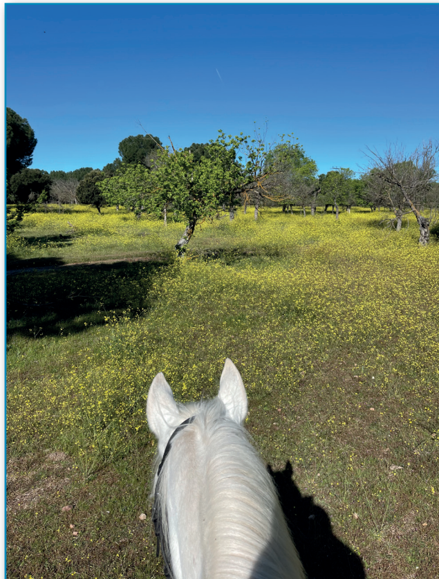
Figura 1. Vistas de una ruta desde el caballo.

Asimismo, se abordarán las cuestiones relacionadas con el cuidado del medio , el bienestar animal y la seguridad de las personas .