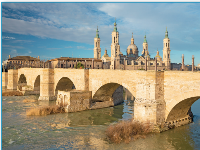
Figura 3. Lugar de interés turístico.