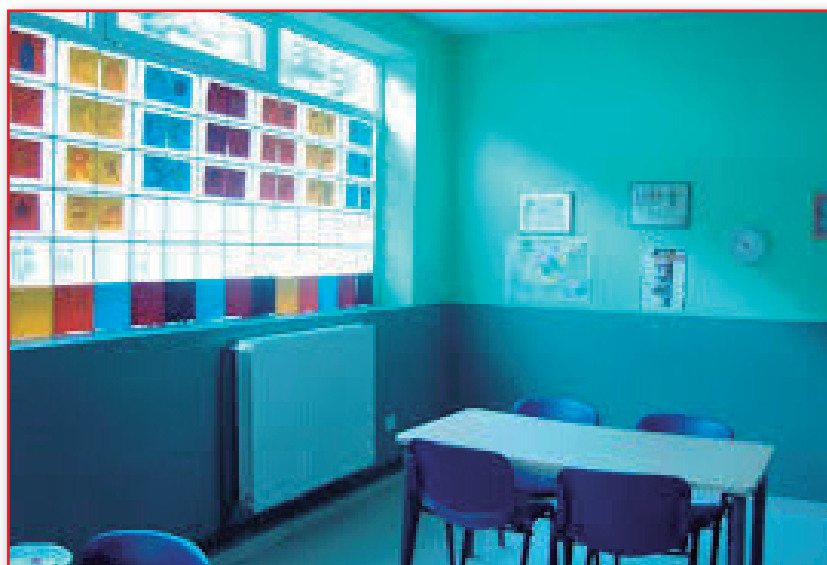
Figura 7. Centro de menores.