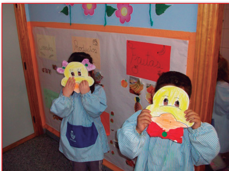
Figura 3. La educación es clave para un desarrollo íntegro del niño.

› Situación en riesgo y la educación. La educación es un factor clave para un desarrollo íntegro de los seres humanos; por tanto, es considerado como un derecho primordial de la infancia. Los padres con niveles bajos de educación favorecen las situaciones en riesgo del menor (Figura 3).