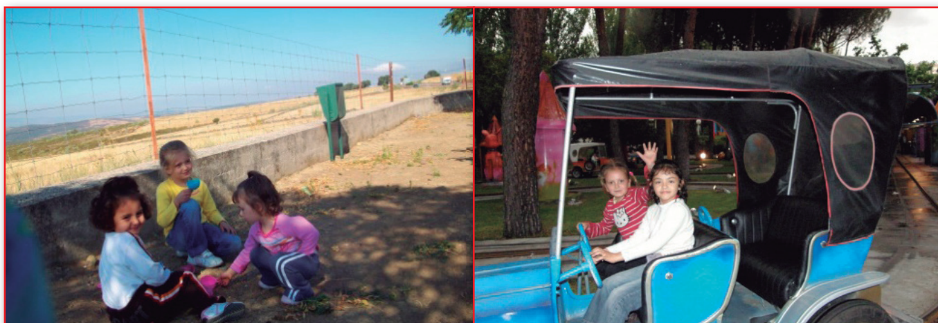
Figura 4. Los niños tienen derecho al descanso, al juego y a las actividades recreativas.

http://www.amnistiacatalunya.org/edu/humor/mafalda/