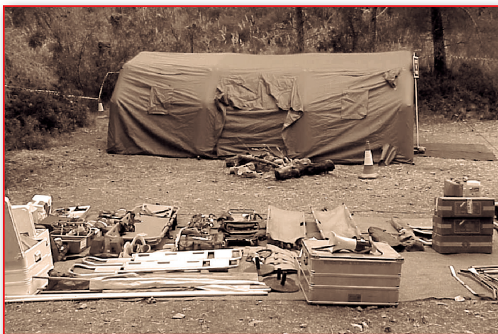
Figura 24. Unidad básica asistencial.

Un elemento que deba funcionar en circunstancias difíciles, meteorología adversa con un mantenimiento muy básico, que pase por muchas manos, necesariamente tendrá que ser muy fiable y robusto, no puede fallar. Los recursos logísticos nos deben ofrecer garantías de uso.