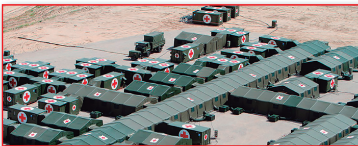
Figura 25. Hospital de campaña del ejército español.

La logística de segunda intervención o logística pesada consiste en el establecimiento de equipos humanos y materiales por tiempos prolongados con recursos estables de acuerdo con la misión que se debe desempeñar. Sus elementos son más confortables. También se aplica al despliegue de formaciones sanitarias de hospitalización (Figura 25).