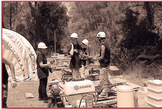
Figura 20. Organización.

Una vez formalizado el plan logístico, comienza su ejecución pensando detenidamente en todos los detalles necesarios para su buen desarrollo, disponiendo de las personas y de los medios necesarios para conseguir los objetivos. Se corresponde con estructurar, coordinar, disponer, ordenar, hacer visibles los medios y los recursos disponibles en las distintas áreas de almacenamiento, durante el transporte y en los lugares de distribución (Figura 20).