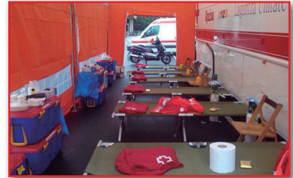
Figura 19. Antena de clasificación: interior del avance.