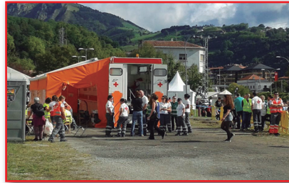
Figura 18. Antena de clasificación desplegada.