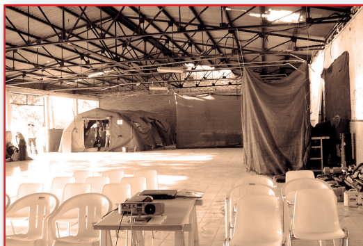
Figura 21. Aprovechamiento de infraestructuras.

char al máximo los movimientos de las personas y los medios, centralizando las actividades para aprovechar mejor la energía, el agua, los alimentos, etc. Todo aquello que disminuya un consumo es logísticamente aceptable (Figura 21).