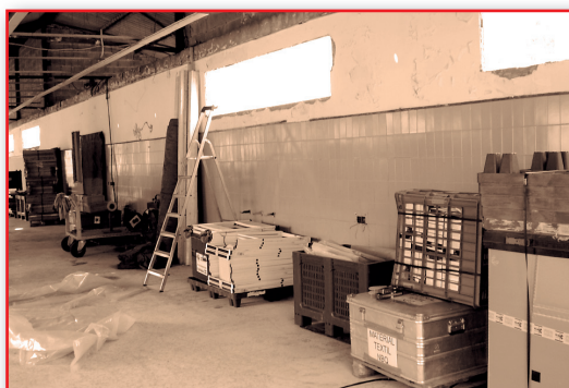
Figura 22. ¡Todo listo!

El patrón oro de la logística consiste en disponer de lo necesario en el momento oportuno y el lugar adecuado, no antes ni después.