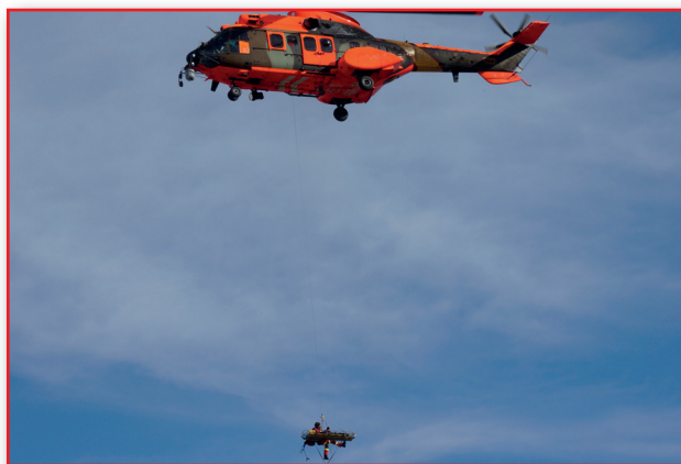
Figura 15. Foto Helicóptero SAR.

https://www.youtube.com/watch?v=Mit5etREh9Q