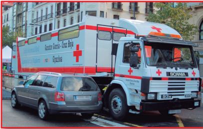
Figura 17. Antena de Clasificación CRE para despliegue de equipos quirúrgicos.